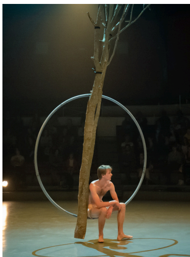
VIVANT; échappée Jef; 2022

Ainsi ils se lancent ensemble dans l'écriture de leur premier spectacle en tant que co-auteurs.