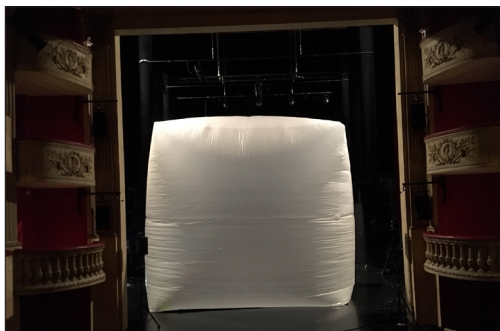
1ères expérimentations de la bulle - La Madeleine, novembre 2020

Cette structure gonflable autoportée permet une variété d'expériences pour les yeux les oreilles et les corps. C'est un animal de plastique qui grandit, informe et gigantesque de 36m 2 au sol, cube de 6m x 6m. Elle devient tour à tour, peau et lanterne magique. Une fois gonflée, le public est invité à entrer à l'intérieur.