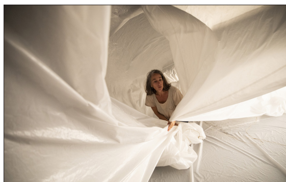
A l'intérieur de la bulle - Les 2 scènes, septembre 2021