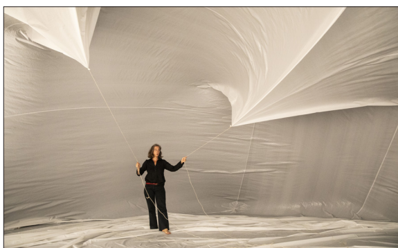
A l'intérieur de la bulle - Les 2 scènes, septembre 2021

De l'intérieur, une membrane minuscule et translucide nous sépare du monde extérieur et pourtant on en est extrait et protégé, le dehors est flouté, on est dans une bulle, matrice rassurante blanche translucide, légère et vibrante de 6m. Cette expérience est rare, rentrer dans un corps, changer radicalement sa perception du dedans et du dehors. Quelle porosité entre les deux ? Un monde intérieur singulier où l'intime se chuchote »