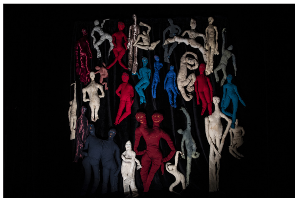
Expérimentation aux 2 scènes - septembre 2021

Il y a une fiction à écrire, des dialogues, des monologues, des questions sur la solitude, ou le manque de solitude que cette double personnalité soulève, comment cohabiter à deux dans un seul corps ? Au-delà de la prouesse technique qui permet un réel trouble ; ventriloquie, mouvements ventraux, contrôle de la respiration, il y a des questions existentielles, celles d'un drame profond en constant frôlement avec l'étrangeté et la drôlerie. https://youtu.be/bNvgip-8Z78