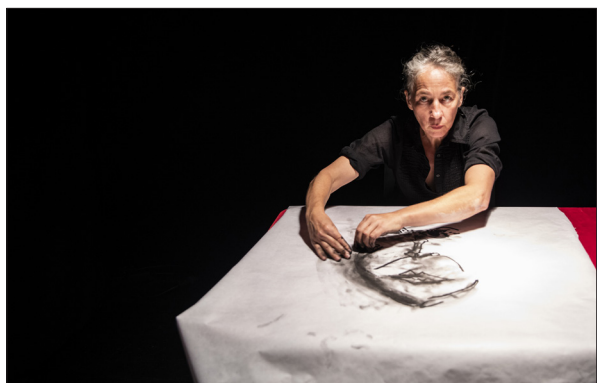
Expérimentation aux 2 scènes - septembre 2021

Aujourd'hui elle continue à fabriquer, coudre et broder ; elle possède un cheptel d'une centaine de monstres, nos semblables.